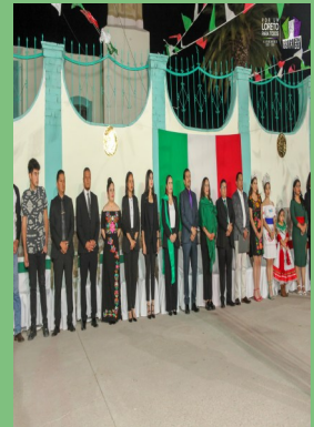
COMINIDAD DE SAN MARCOS, LORETO, ZAC.