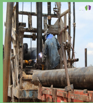
COLOCACIÓN DE TUBERÍA PARA LA CONSTRUCCIÓN DEL POZO DE AGUA POTABLE EN LA COMUNIDA DE BIMBALETES