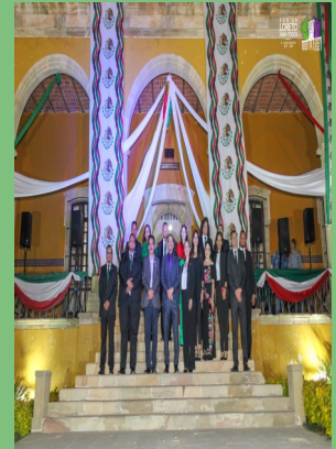
GRITO DE INDEPENDENCIA EN LA ESCUELA NORMAL RURAL "GRAL. MATÍAS RAMOS SANTOS", SAN MARCOS. LORETO, ZAC.