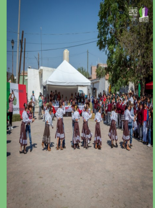
CON UN BONITO FESTIVAL POR LA CELEBRACIÓN DEL GRITO DE INDEPENDENCIA, LAS ESCUELAS PREESCOLAR, PRIMARIA Y SECUNDARIA DE LA COMUNIDAD DE TIERRA BLANCA . LORETO, ZAC. CELEBRARON LAS FIESTAS PATRIAS