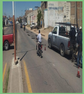
EL DEPARTAMENTO DE OBRAS PÚBLICAS REALIZÓ BACHED EN DIVERSAS CALLES DE LA CABECERA MUNICIPAL