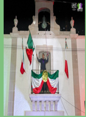
PLAZA PRINCIPAL LORETO