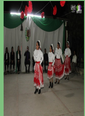
CRISÓSTOMOS, LORETO, ZAC.