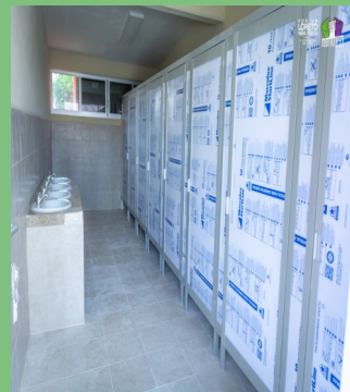
REHABILITACIÓN DE SANITARIOS ESCOLARES EN LA ESCUELA PRIMARIA "MANUEL RANGEL MARTÍNEZ" DE LA CABECERA MUNICIPAL